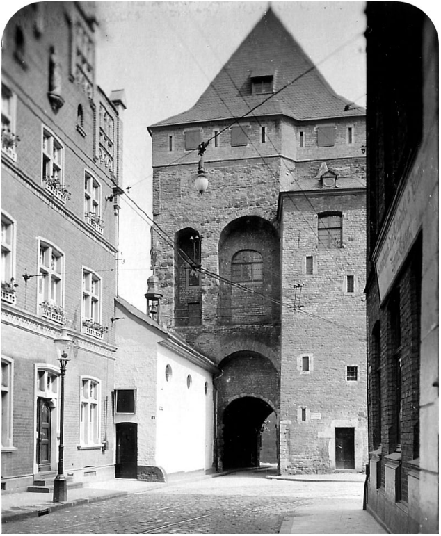
Das ist ein Foto etwa aus dem Jahr 1910. Man sieht die Obertorkapelle in der Oberstraße.