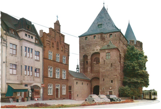
Das ist eine Postkarte aus dem Jahr 1965. Man sieht das Obertor aus Richtung Norden.